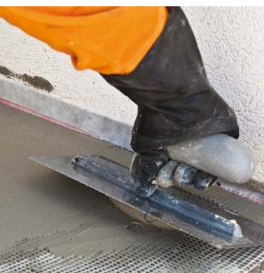
Applicazione di Poligum A+B con spatola metallica liscia