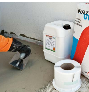
Poligum A+B e bandella elastica